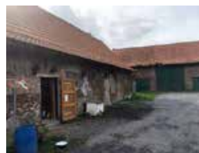
Het gemeentebestuur voert onze verkiezingsbelofte alvast uit en breekt de bouwvallige hoeve Vercaemer af.