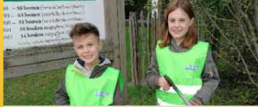
N-VA Lendeledede steunt de 'Mooimakers' (p. 2)