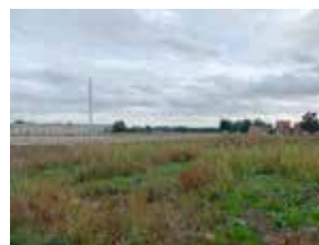
Tijd voor actie aan site Nelca!

"De gemeente moet ook denken aan de lange termijn en bijvoorbeeld de veiligheid van de openbare lokalen garanderen. Een vernieuwing van de lokalen van de jeugdbewegingen en het DOC dringt zich op, zodat uw kinderen en kleinkinderen zich in alle veiligheid kunnen ontspannen en ontwikkelen. De N-VA rekent er ook op dat de gemeente meer stuwkracht geeft aan lopende projecten zoals Nelca en hoeve Vercaemer. Dat zou een sprong vooruit betekenen voor onze lokale economie. Genoeg manieren dus om ervoor te zorgen dat u als inwoner de vruchten plukt van de Vlaamse middelen."