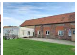
Zowel de chirolokalen als de lokalen van het DOC zijn dringend aan een opknapbeurt toe.