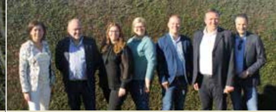
Maak kennis met uw N-VA-vertegenwoordigers (p. 3)